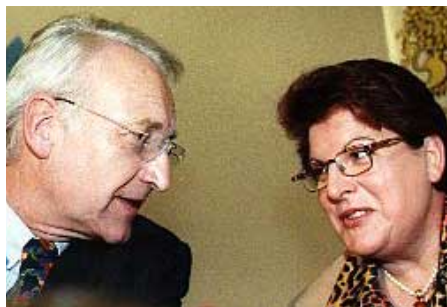
Abtreibungsgegner Stoiber, Stamm Freund-Feind-Denken stark ausgeprägt

Fünf Jahre arbeitete er als Notarzt, 1980 eröffnete er mit einem Kollegen in Wiesbaden seine erste – gutgehende – Abtreibungspraxis. Zwei Jahre später landete er für ein paar Wochen im Gefängnis – wegen des Konsums von Kokain. Ein Drogendealer hatte ihn verpiffen.